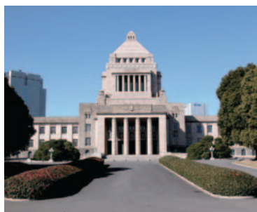
衆議院の構成は、小選挙区三百人、比例区百八十人の合計四百八十人であることをまずご承知置き下さい。

まず給料にあたる歳費ですが、これは「国会法」という法律で政府各省の次官給に準拠、ということにきまっています。意外に低く百三十万円です。ただし公務員並みに期末手当。昨