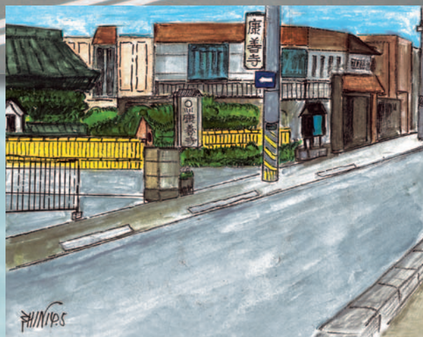
(法人ニュースふくしま 2002年5月号より)