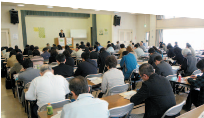
▲ 22・4・14 決算説明会