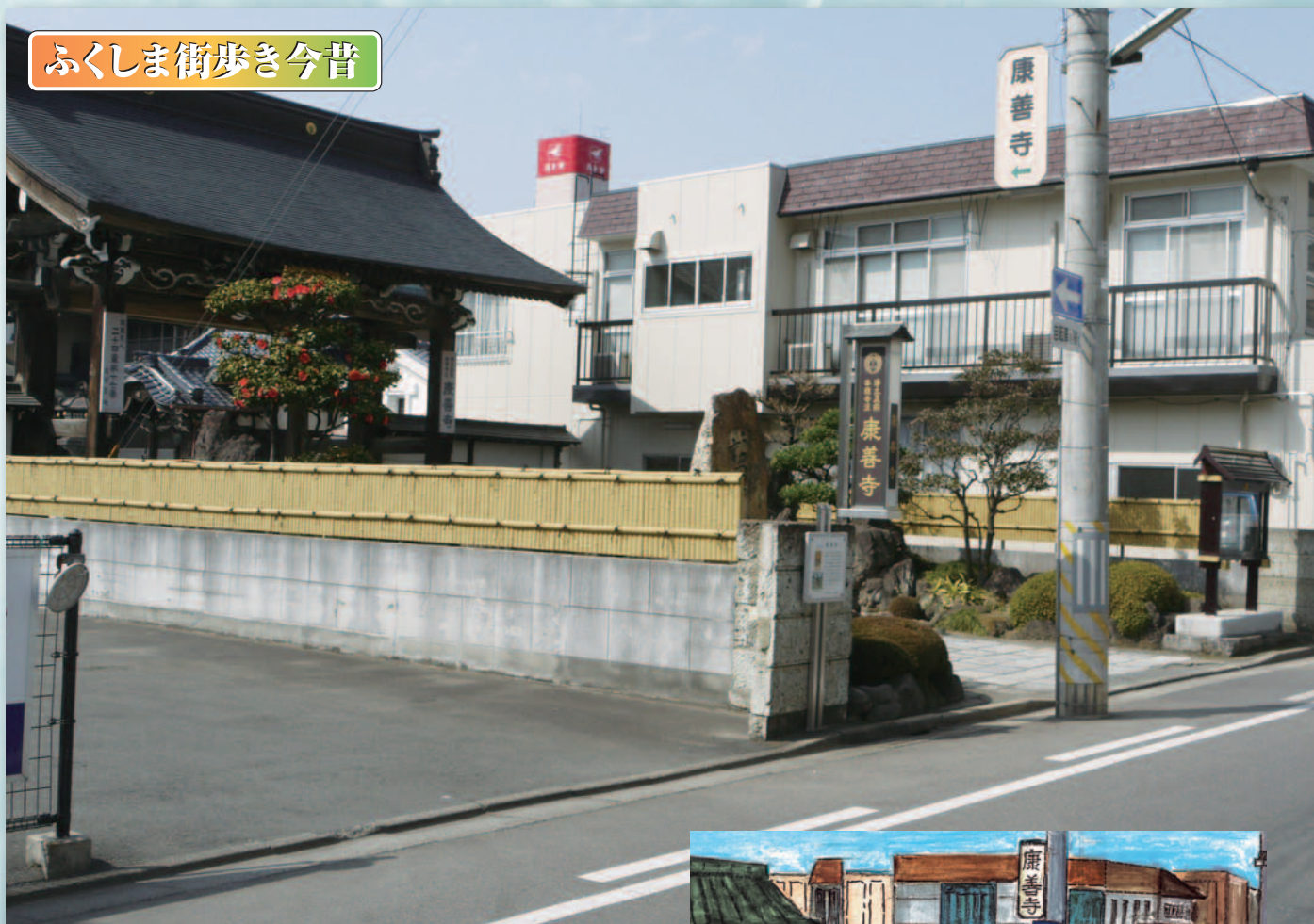
「寺町通り界わい」(福島市五月町)