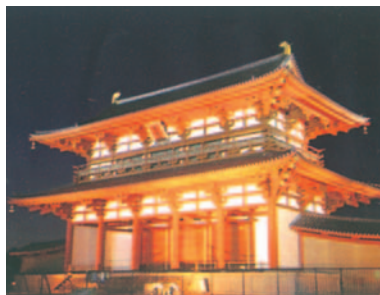
朱雀門(すざくもん)

た。メインイベントの「天平行列」は五月九日ですが引き続き十一月七日まで、かつての平城京の華やきを偲ばせるさまざまな行事や展示の催しが行なわれるようです。また、記念祭に間に合わせるべく復元を急いでいた平城宮跡の壮大な大極殿と