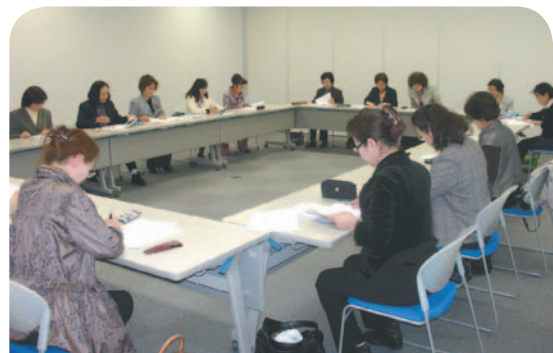
▲ 22・4・6 女性部会第1回役員会 ・平成21年度事業経過報告並びに収支決算について ・平成22年度事業計画(案)並びに収支予算(案)について ・第21回定時総会(22・4・1)役割分担等について ・その他