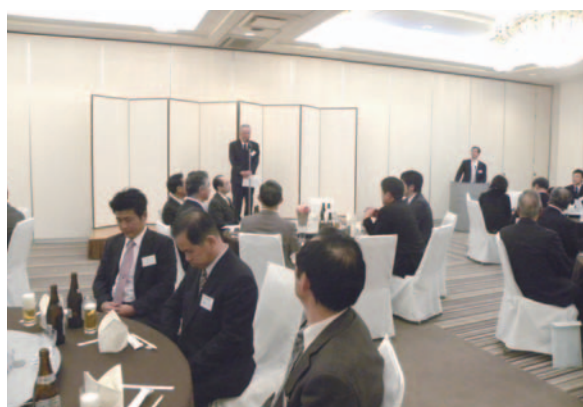
和やかな懇談会の様子