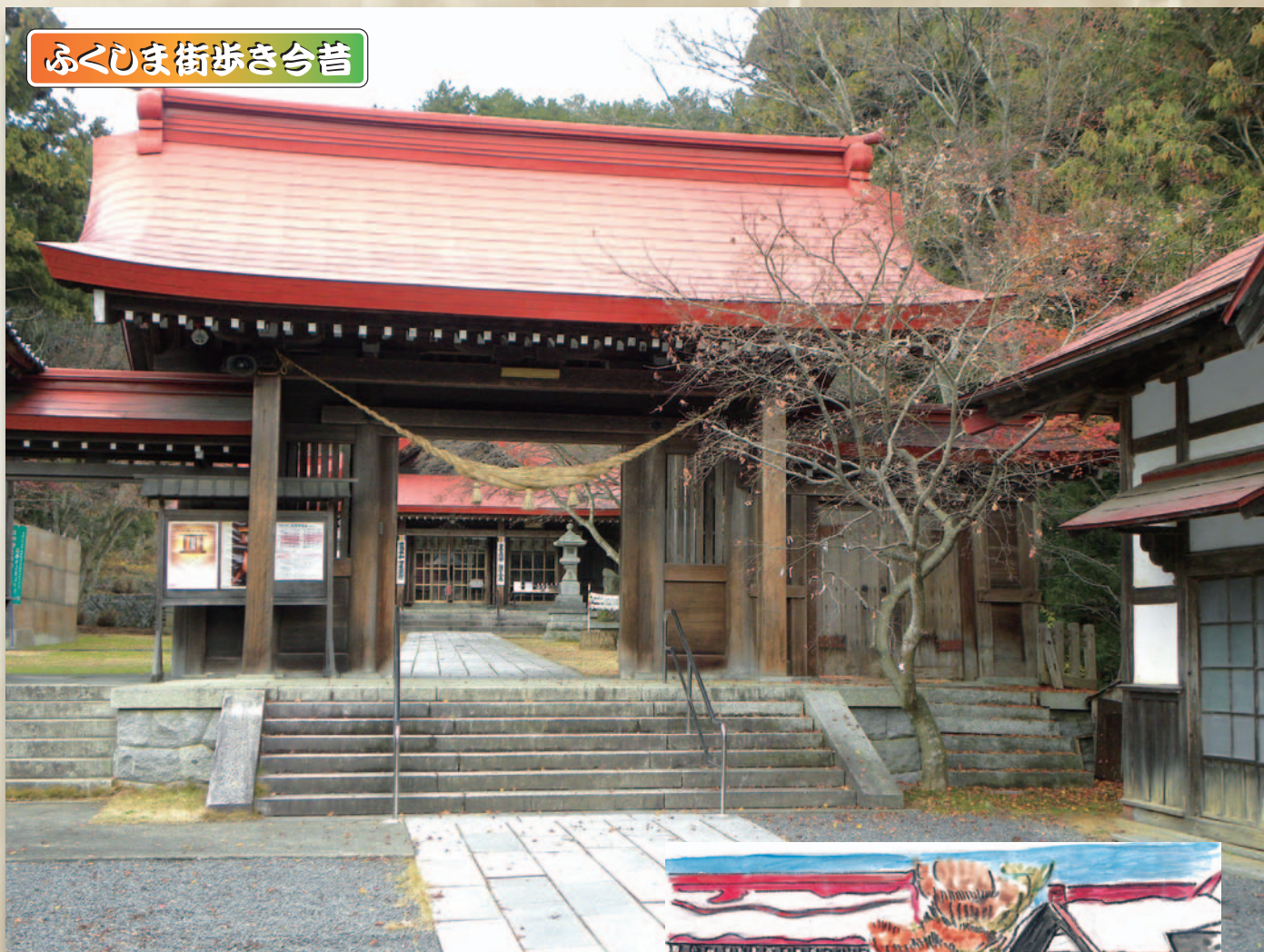
「霊山神社」(伊達市霊山町)