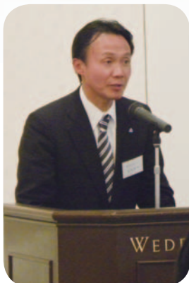
自己紹介をする参加者