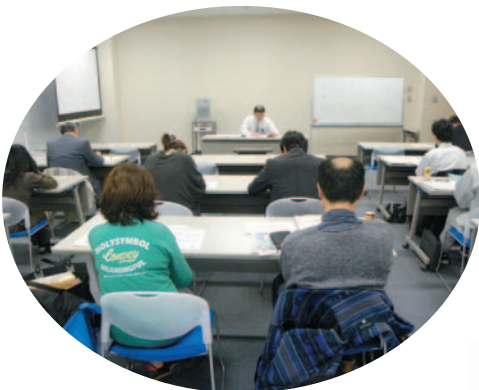
▲ 22・11・24 新設法人説明会