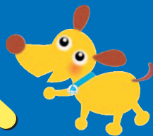
法人会キャラクターけんたくん