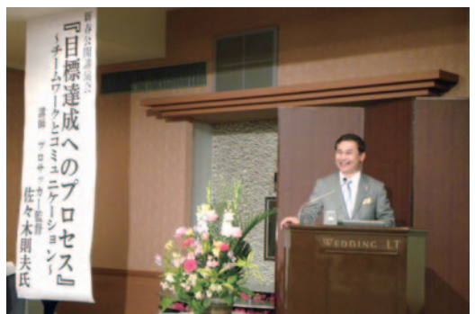
講師の佐々木則夫氏

当会の新春公開講演会は2月2日(木)午後3時よりウエディングエルテイにおいて、女子サッカーなどでしこジャパンの佐々木則夫氏を迎え「目標達成へのプロセス」チームワークとコミュニケーション」をテーマに600名の参加で開催された。