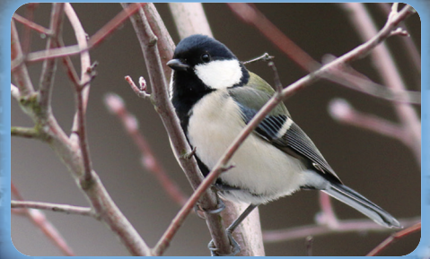
福島市の【シジュウカラ】昭和62年3月制定 四季を通じて市内に生息し、身近に見られ、他の鳥と識別しやすく、広く市民に親しまれている鳥です。