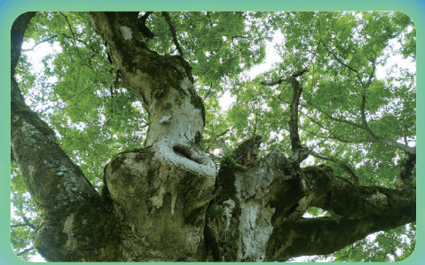
福島市の【ケヤキ】平成元年3月制定 堂々と根を張り、枝を繁茂させる旺盛な樹勢と美しい樹枝は、「伸びゆく福島」を象徴するもの。