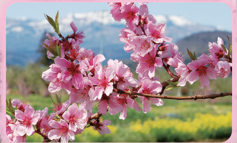
福島市の【モモ】平成元年3月制定 春、市の郊外を美しく彩るモモの花は、信夫野の風物として心を和ませ、希望と活力を与えてくれます。