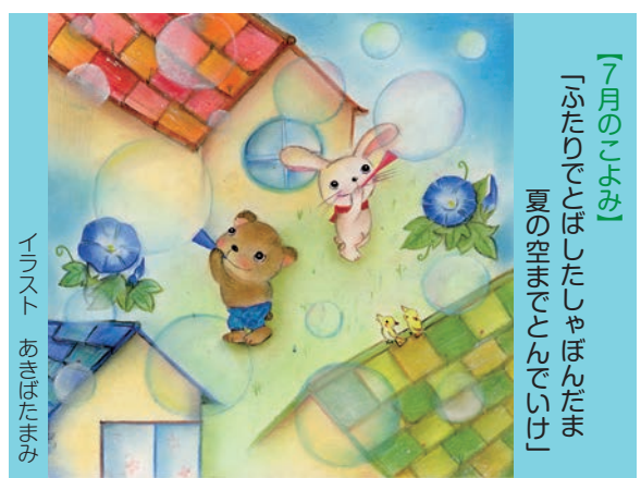
「7月のこよみ」 「ふたりでとばしたしゃぼんだま 夏の空まごころでいけ」

そして算額というものを作り、そこに問題と回答を書き記した。それを神社や仏閣の拝殿に奉納した。福島県内の和算家は江戸時代末期から明治になった頃、約1万人弱いたというから日本でも有数の和算王国であった。