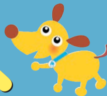
法人会キャラクターけんたくん