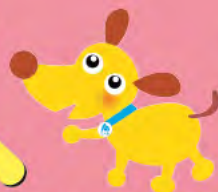
法人会キャラクターけんたくん