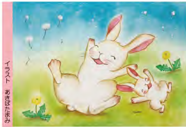
イラスト あきはたまみ