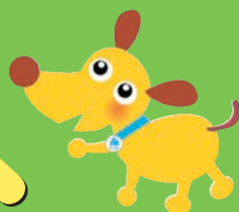
法人会キャラクターけんたくん