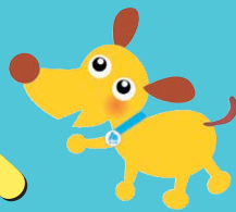
法人会キャラクターけんたくん