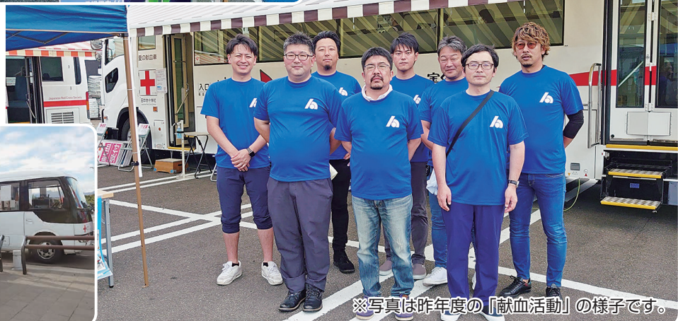
※写真は昨年度の「献血活動」の様子です。