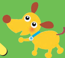
法人会キャラクター けんたくん